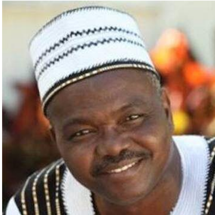
Patrice Malidoma Somé